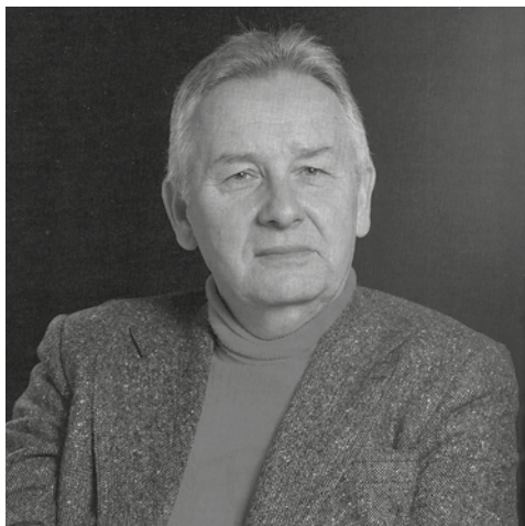
Henryk Mikołaj Górecki.